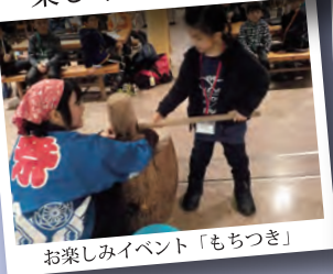
お楽しみイベント「もちつき」