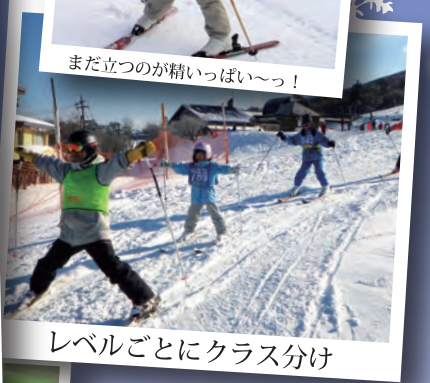
レベルごとにクラス分け