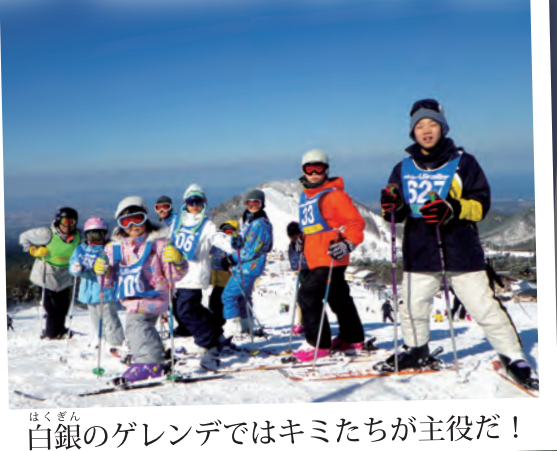
白銀のゲレンデではキミたちが主役だ！