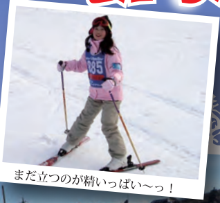
まだ立つのが精いっぱい〜！