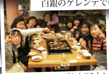
夜は夕食やイベントで盛り上がりよう♪