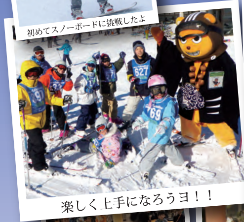
楽しく上手になろうヨ！！