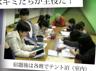
宿題後は各班でテント泊（室内）