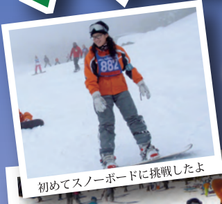
初めてスノーボードに挑戦したよ